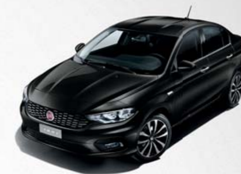
718 PRETO CINEMA METALIZADO