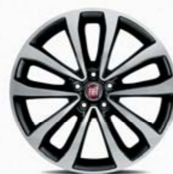
Jantes em liga leve de 17" adamentadas