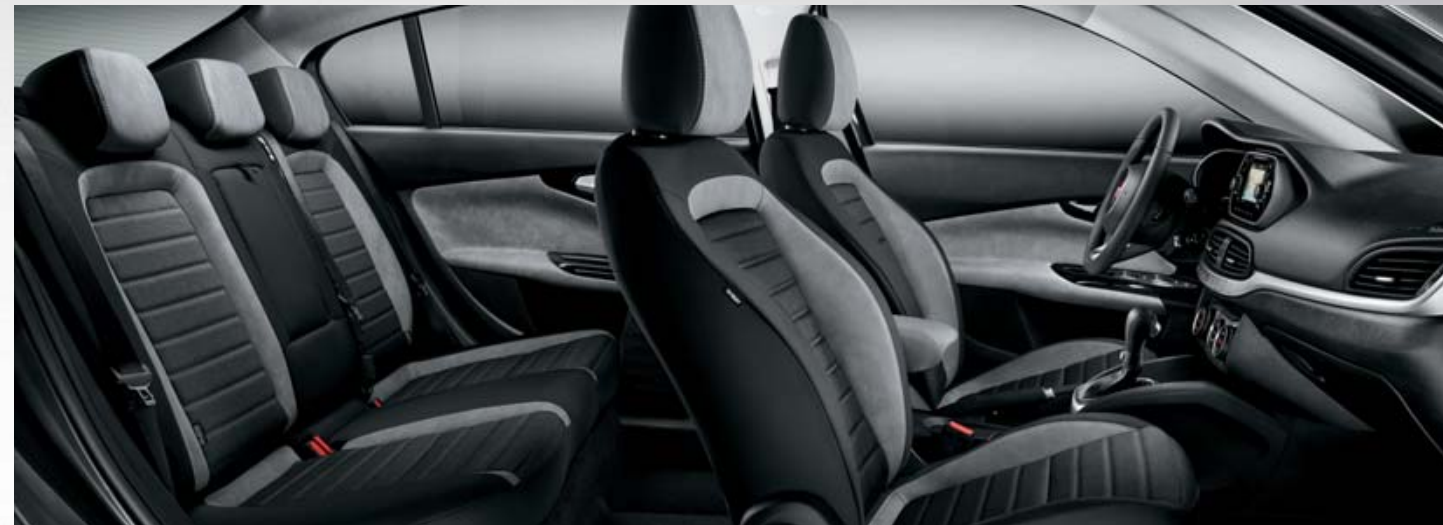
LOUNGE - INTERIOR EM ECOPELE CINZENTO.