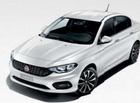
249 BRANCO GELATO PASTEL