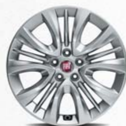
Jantes em liga leve de 16"