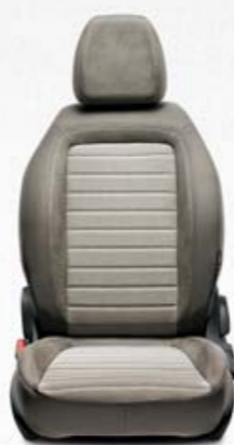
LOUNGE BEGE Ecopele bege