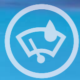
SENSORES DE CHUVA