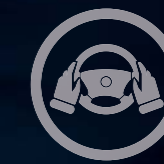
COMANDOS NO VOLANTE