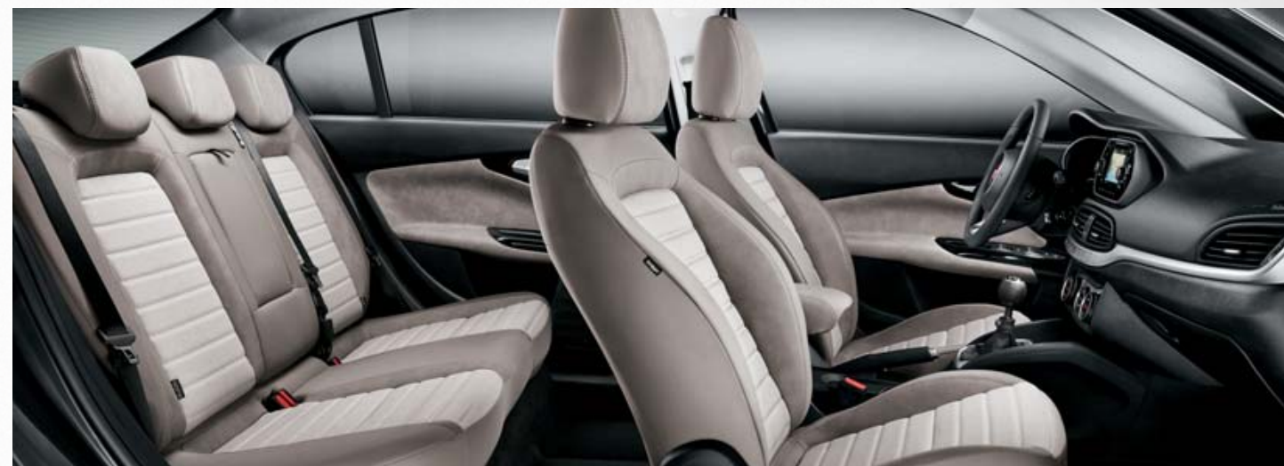
LOUNGE - INTERIOR EM ECOPELE BEGE.