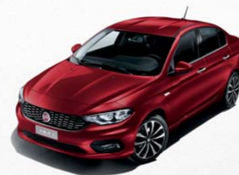
716 VERMELHO AMORE METALIZADO