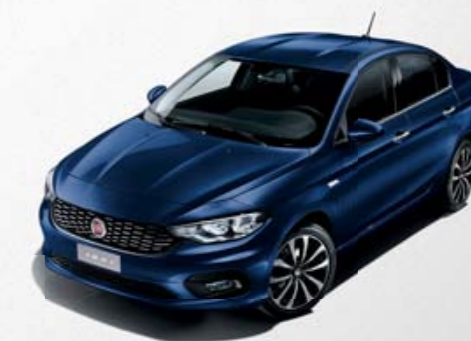
717 AZUL MEDITERRANEO METALIZADO