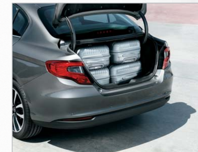
A abertura da bagageira é ampla e de fácil acesso para simplificar as operações de carga e descarga.

Todo o conforto de que precisa em 4,54 metros de comprimento. O novo Tipo oferece habitabilidade "best in class", com cinco lugares cómodos e envolventes, quatro alternativas de revestimento interno