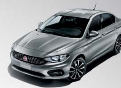
612 CINZENTO MAESTRO METALIZADO