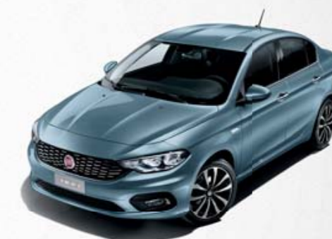
448 AZUL CLARO CANALGRANDE METALIZADO