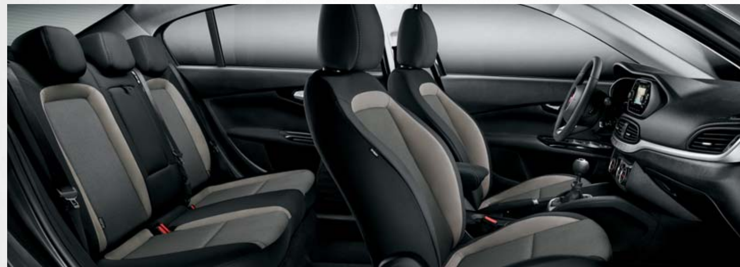
EASY - INTERIOR EM TECIDO CINZENTO.