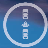
SENSORES DE ESTACIONAMENTO