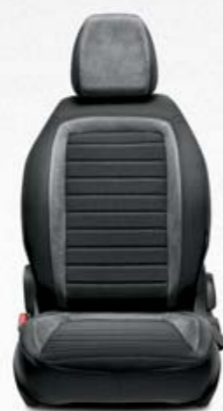
LOUNGE CINZENTO Ecopele cinzento