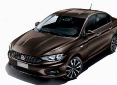
444 BRONZE MAGNETICO METALIZADO