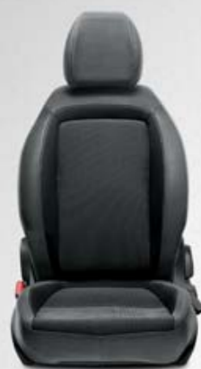
EASY CINZENTO ESCURO Tecido em cinzento escuro