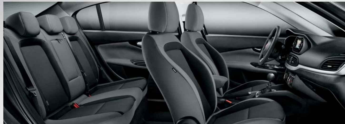
EASY - INTERIOR EM TECIDO CINZENTO-ESCURO.