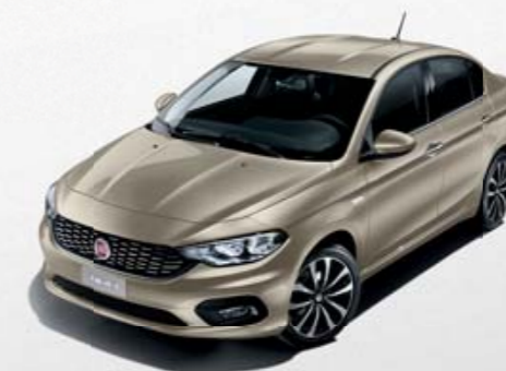
722 PÉROLA SABBIA METALIZADO