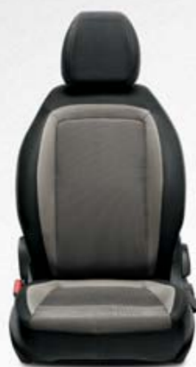
EASY CINZENTO Tecido em cinzento