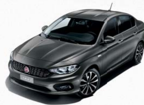
695 CINZENTO COLOSSEO METALIZADO