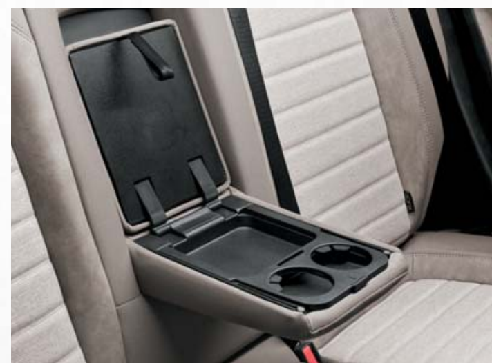
Apoio de braços central traseiro com armazenamento e suportes para copos (opcional).