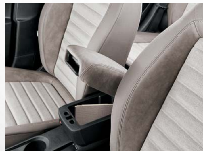
Apoio de braços dianteiro com compartimento para arrumação (de série na versão Lounge).