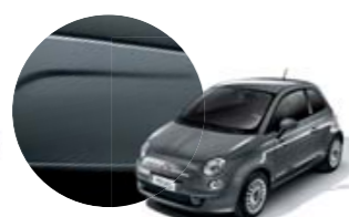
695 Cinzento Sfrenato