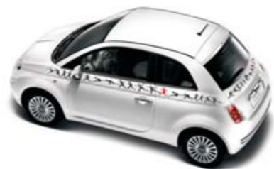
●○ Humanóide Berlina/Cabrio