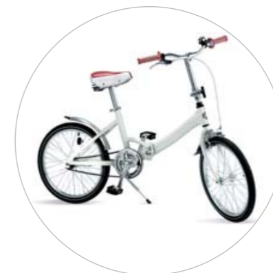
Bicicleta dobrável com estrutura de alumínio.