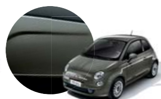
372 Cinzento Adrenalinico