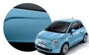
952 Azul Volare