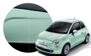
166 Verde Menta