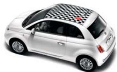
●○ Teto em xadrez