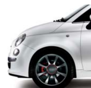
Lineaccessori 56J (16")