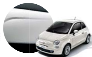
268 Branco Bianco