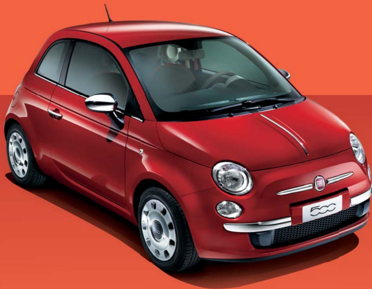
Kit Cromo (opcional)

“Espírito Pop e pormenores dignos de uma estrela. Gosto de ser assim.”