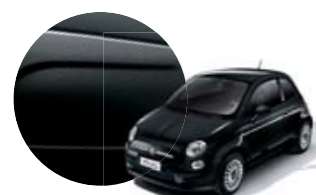
876 Preto Metallizzato