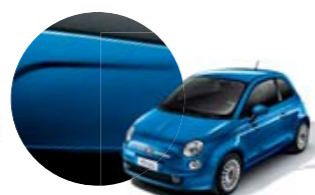
425 Azul Italia