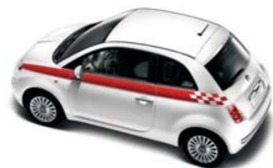
●○● Faixa Sport lateral Berlina/Cabrio