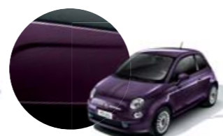
528 Violeta Magico