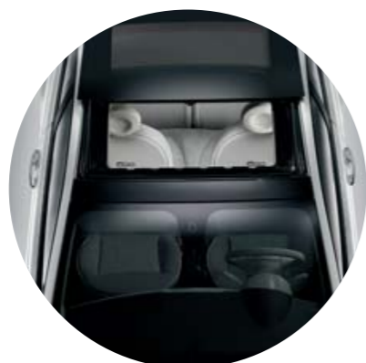
Teto de abrir elétrico (opcional)