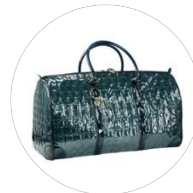
Bolsas em plástico-bolha.