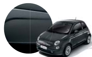
735 Cinzento Imprevedibile