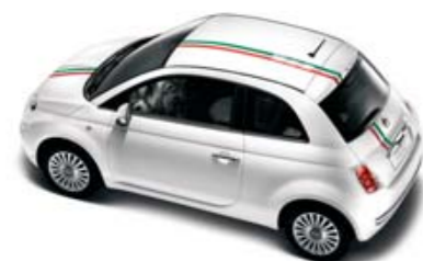
● Risca 500 Itália