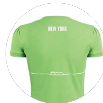
T-shirt de mulher.