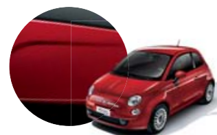
111 Vermelho Sfrontato