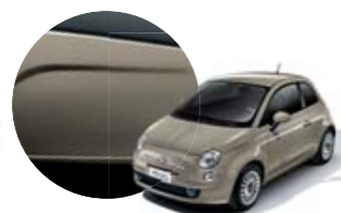
231 Bege Cappuccino