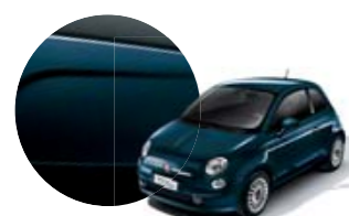
687 Azul Cosmico