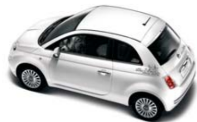
●○ New York Berlina/Cabrio