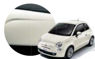
227 Branco Ghiaccio