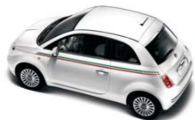
● Faixa lateral Itália Berlina/Cabrio

●○ Capa de retrovisor personalizada com Borboletas ou Flores em amaranço ou marfim sobre fundo preto.