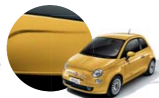
712 Amarelo Sole