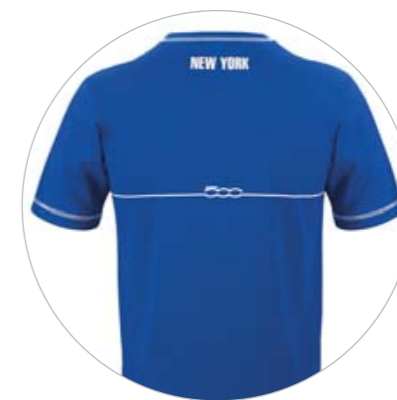
T-shirt de homem.